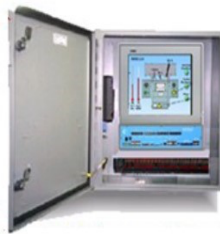
Armario cerrado QVISION partransformador o generador

QVISION también se utiliza como HMI de QEI para nuestros dispositivos de monitoreo de transformadores y monitoreo/control/comunicación de generadores.